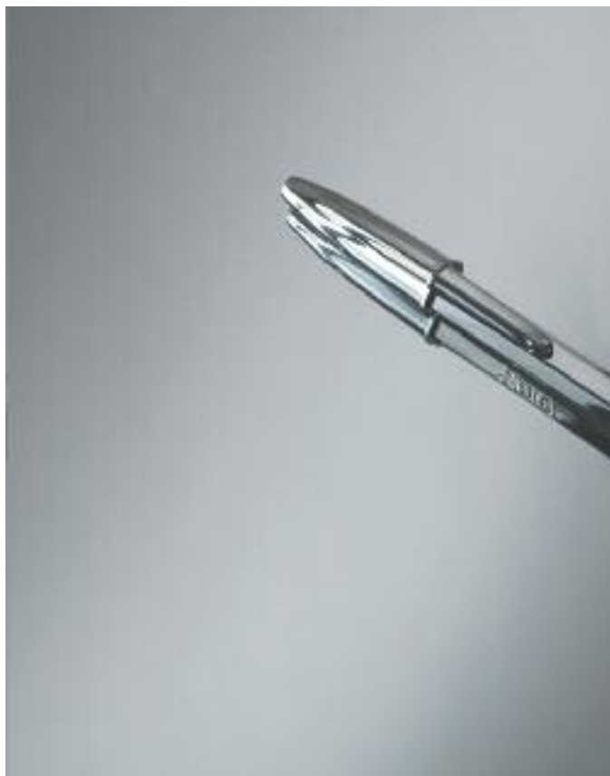
FR 3 mm